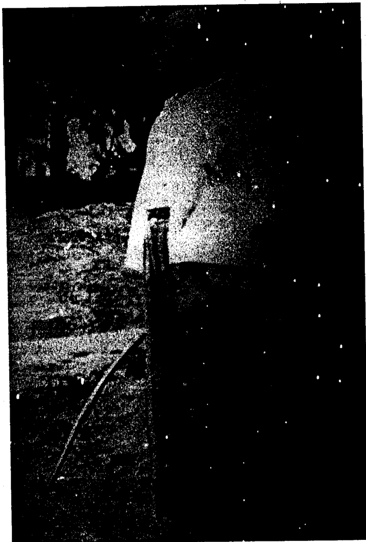
Figura 59. Manoel dos Reis Machado, o Mestre Bimba, criador da Luta Regional Baiana, depois chamada de Capoeira Regional, na década de 30.