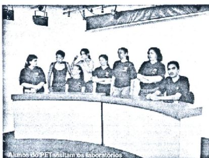
Alunos do PET visitam os laboratórios

Alunos do PET I (Programa de Educação para o Trabalho) participaram no dia 01 de março de uma visita à Universidade de Sorocaba - UNISO para conhecer as instalações dos Laboratórios de Comunicação destinados aos cursos de Jornalismo e Publicidade e Propaganda.