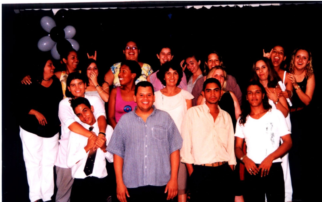
Foto: Alunos do PET 2 durante uma aula do Núcleo Central.