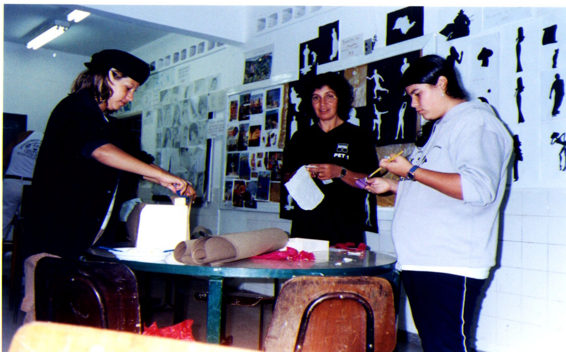
Alunos utilizando a camiseta preta com o logotipo SENAC e PET 1.

O uniforme foi usado pela maioria dos alunos no dia-a-dia do curso, sendo dispensado nas ocasiões festivas ou quando se realizava alguma atividade da oficina. Alguns alunos não o usavam porque iam direto do trabalho para o curso ou da escola para o passeio.