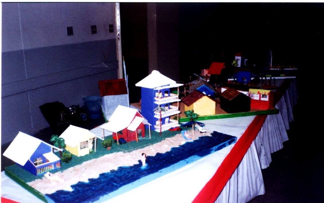
A foto acima mostra algumas maquetes construídas pelos alunos.

Outra dinâmica utilizada durante a oficina foi a criação da capa de um CD, sendo que na parte interna, cada aluno deveria escrever as suas impressões a respeito do mundo e suas preferências pessoais.